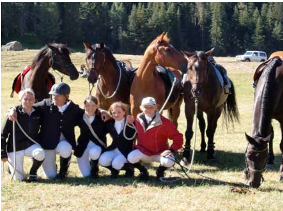
Gratulation an die Teilnehmer der Sportwoche am Concours Hippique in St. Moritz