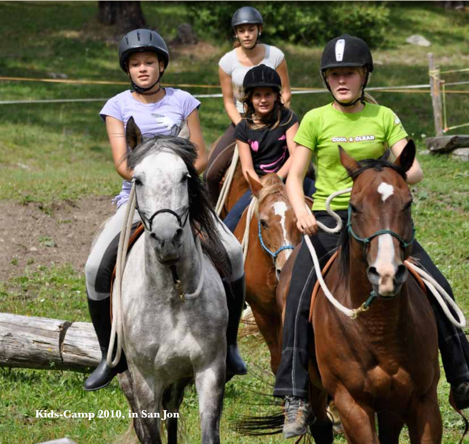
Kids-Camp 2010, in San Jon

Schweiz: Tel. +41 (0) 81 833 83 73 :: Deutschland & Österreich Tel. +40 (0) 421 244 49 11