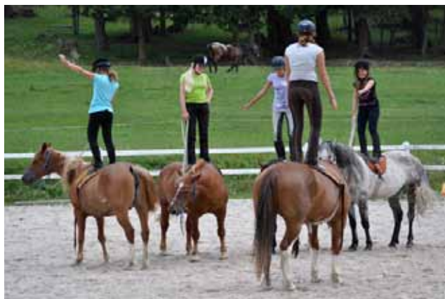
Girls,Girls, Girls - im Kids Camp in San Jon

Und weiter gehts mit Kursen und Schnupperweekends. Eine L2 Trekkingwoche im Engadin steht im September noch auf dem Programm. Wer Lust und Zeit hat, ist herzlich eingeladen!