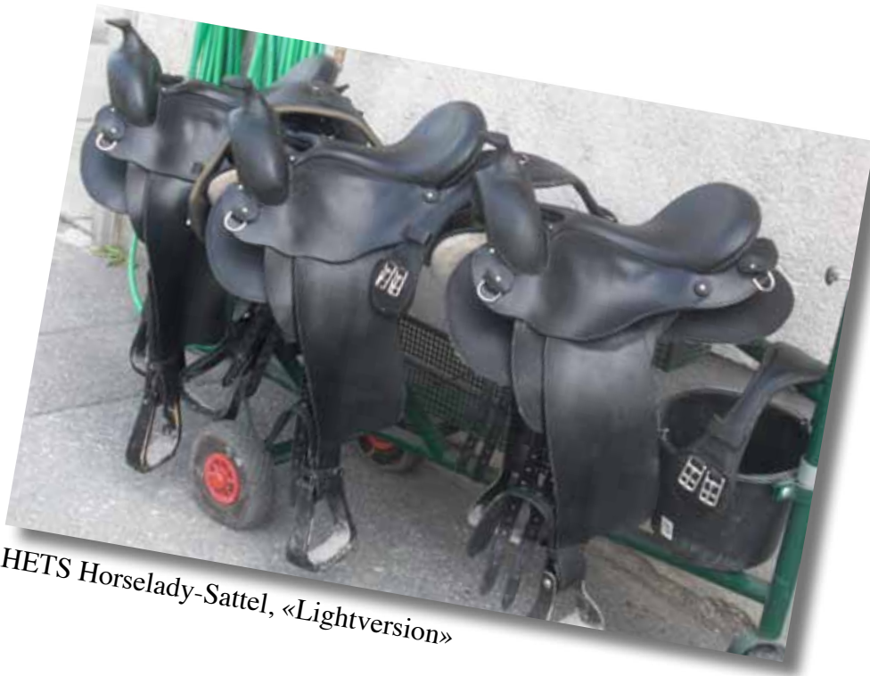
HETS Hetselady-Sattel, «Lightversion»

Sattelsystem: siehe Text auf der Website www.hets4you.ch .